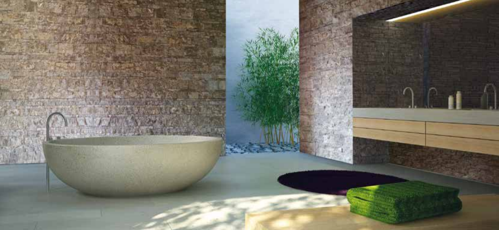
Verkleidung von Bad und Sanitärflächen: Pfraundorfer Dolomit, Schichtverblender, gespalten