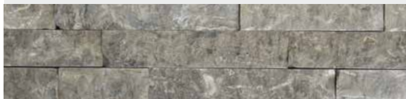
Pfraundorfer Dolomit, Schichtverblender, gespalten