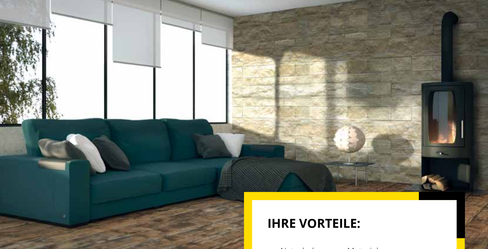
Wohnbeispiel: Verkleidung mit Jura Kalkstein, Schichtverblender, gespalten