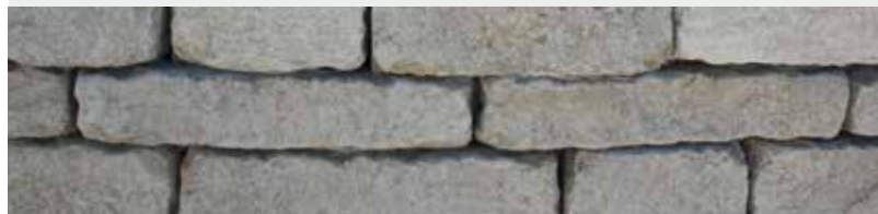
Jura Kalkstein, Schichtverblender, gespalten und getrommelt

Unsere Naturstein-Verblender sind auch in antik getrommelt erhältlich.