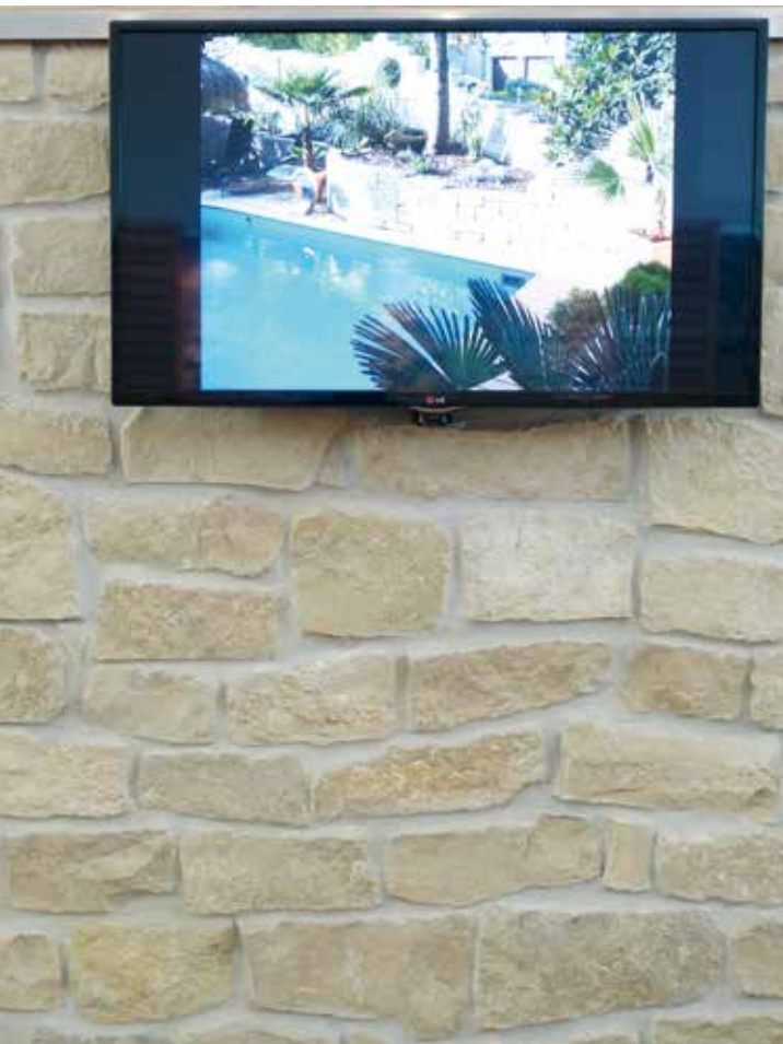
Jura Kalkstein, Romulusverblender, gespalten

Mit den erstklassig verarbeiteten Naturstein-Verblendern können Sie nahezu jede Ober- und Ansichtsfläche veredeln – ganz natürlich.