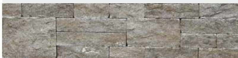
Kirchheimer Muschelkalk, Systemverblender, gespalten