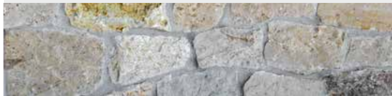
Jura Kalkstein, Romulusverblender „Rustikal“, gespalten