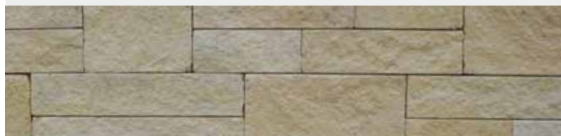
Warthauer Sandstein, Systemverblender, gespalten