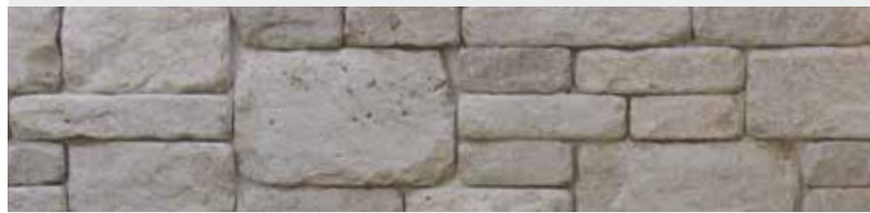
Jura Kalkstein, Systemverblender, getrommelt