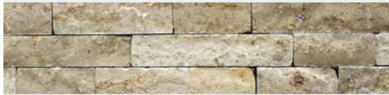
Jura Kalkstein, Schichtverblender, gespalten