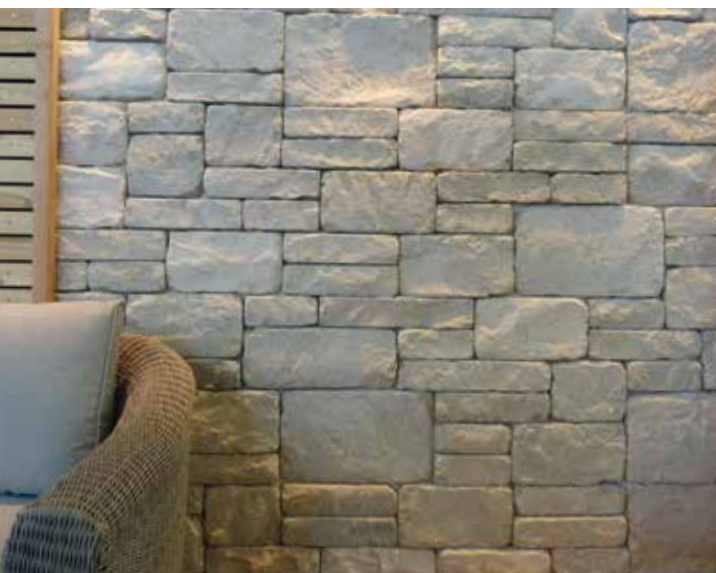
Jura Kalkstein, Systemverblender, getrommelt